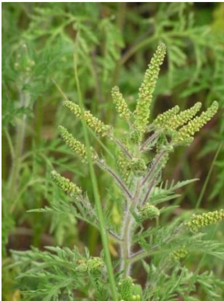
1 pied d'ambrosie = 1 million de grains de pollen + des centaines de graines